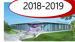
LA CHAPELLE ST LUC